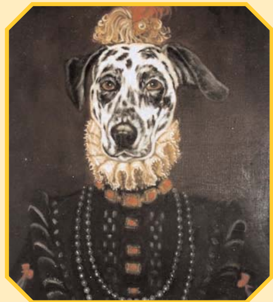
Lula - oleo de 55 x 46 cm www.francisdeblas.com