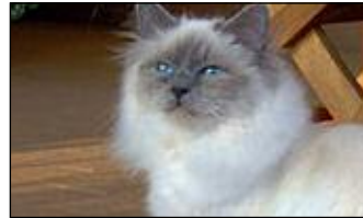
Sagrado de Birmania

❗ Según una hipótesis actuaban como custodios de los templos budistas.