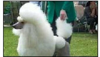
Caniche - Poodle

❗ Se da como cierto que desciende del Barbet francés, originario de Africa.